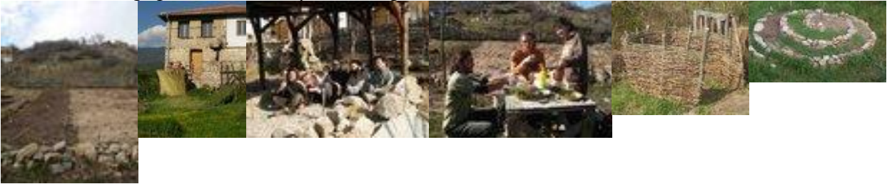
Доброволчески уикенди 2011