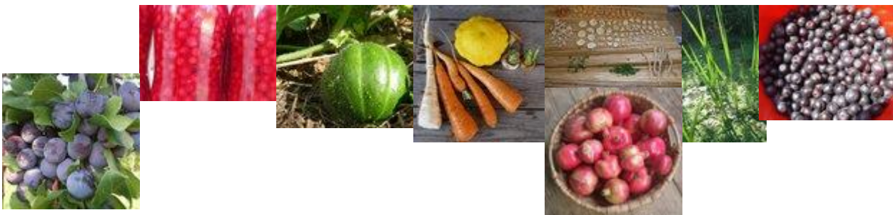
Реколтата от градината на Училището за 2011