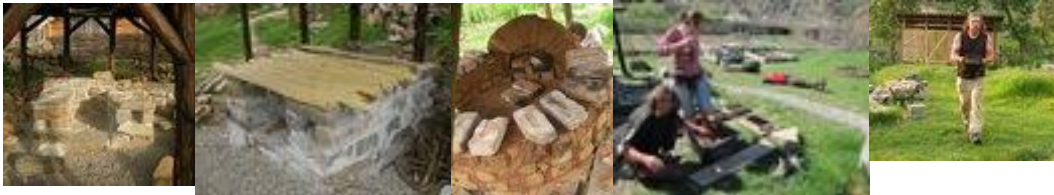
Строеж на традиционна пещ