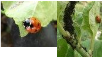
Част от интегрираната биологична система за опазване на градината от вредители